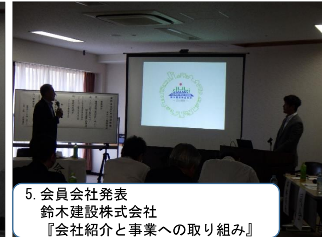
5. 会員会社発表 鈴木建設株式会社 『会社紹介と事業への取り組み』