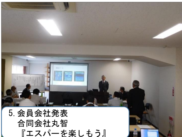
5. 会員会社発表 合同会社丸智 『エスパーを楽しもう』