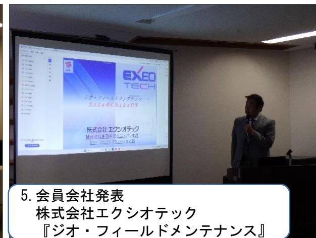
5. 会員会社発表 株式会社エクシオテック 『ジオ・フィールドメンテナンス』