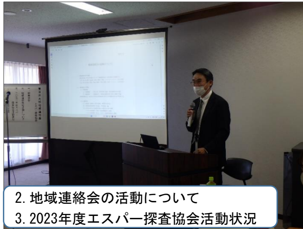
2. 地域連絡会の活動について 3. 2023年度エスパー探査協会活動状況